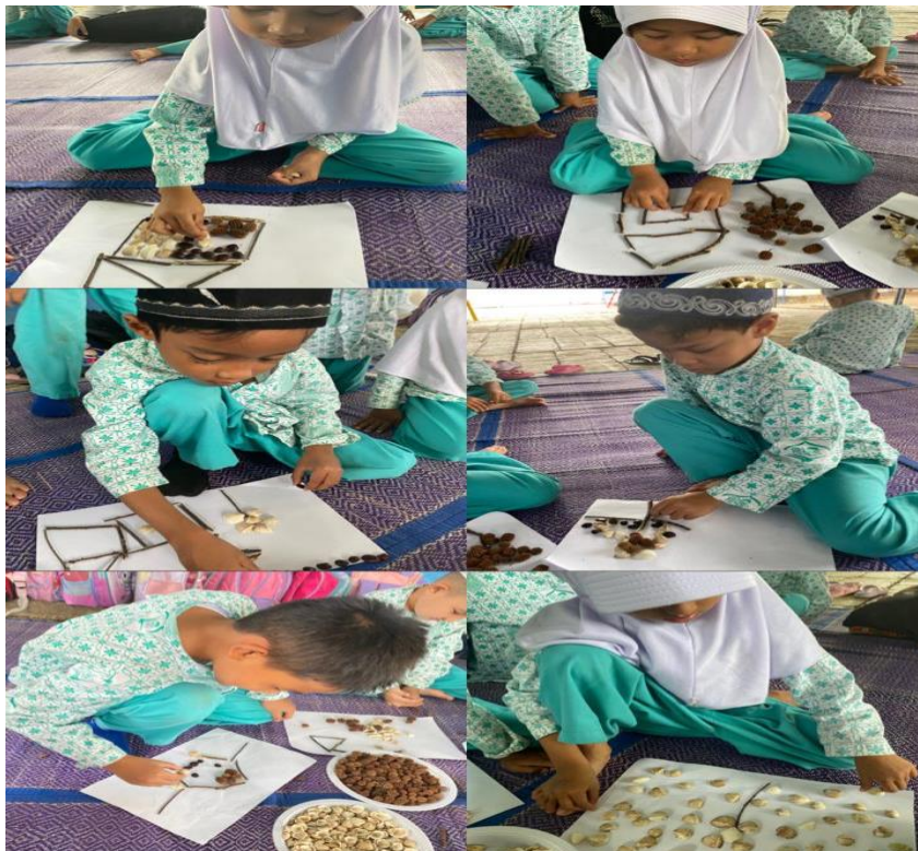
Kegiatan anak dalam mengembangkan kreativitasnya