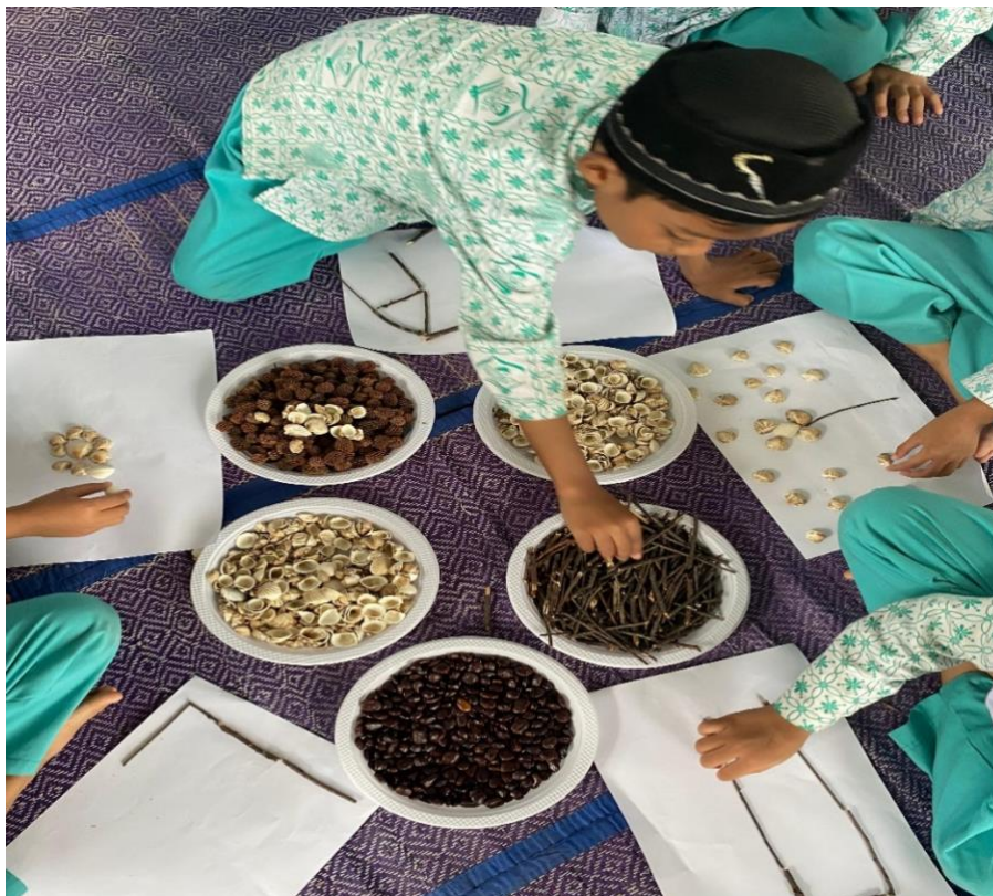
Antusias anak dalam bermain dengan media loose part