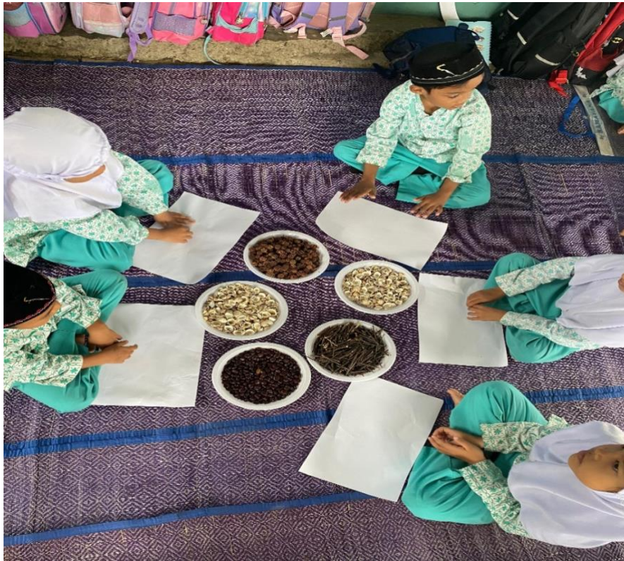
Peneliti mempersiapkan media loose part untuk proses bermain