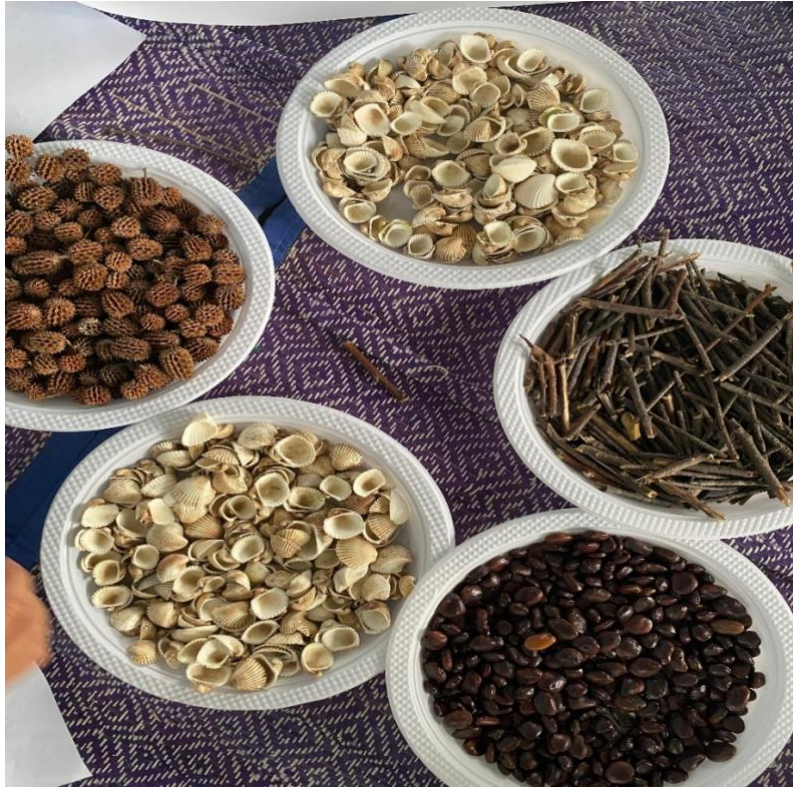
Gambar media loose part