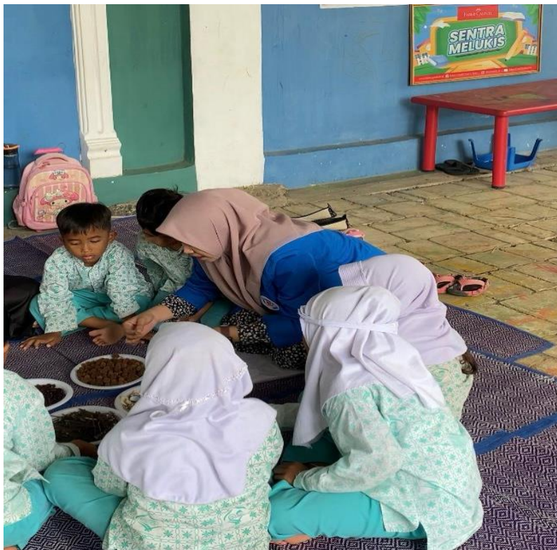
Peneliti sedang memperkenalkan media yang akan di mainkan.