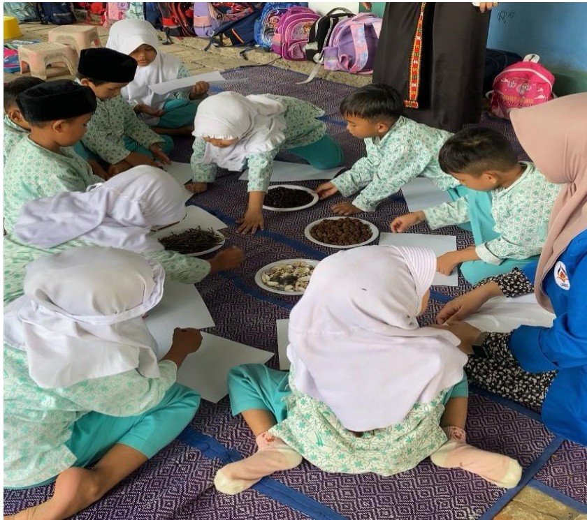
Peneliti memantau proses kegiatan bermain dengan media loose part