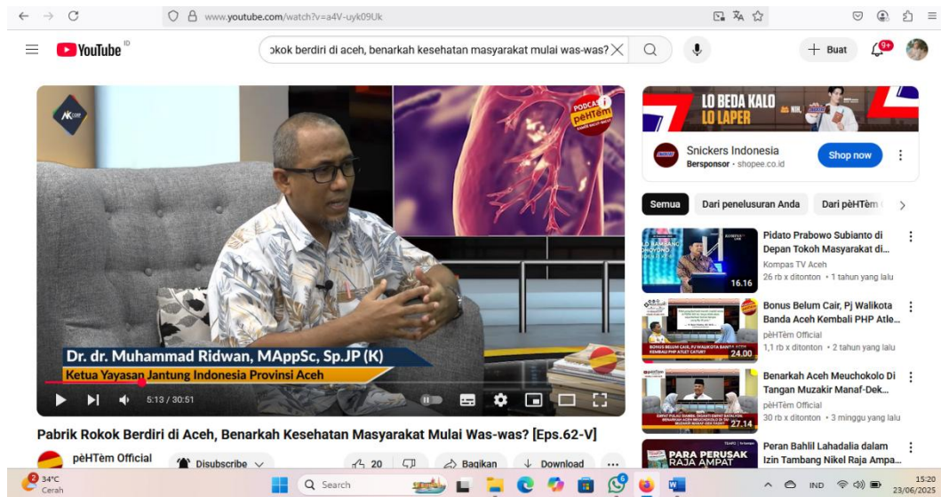
Gambar 3.3 Video Kedua

( https://youtu.be/a4V-uyk09Uk?si=2YPe6G_oXtF1xtG7 )