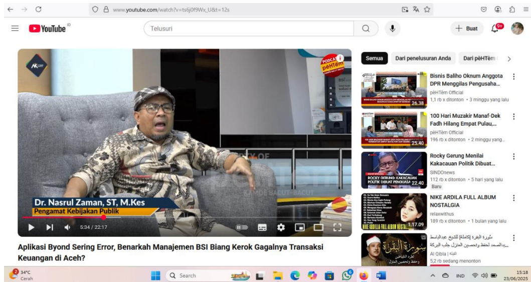
Gambar 3.2 Video Pertama

dilihat jumlah subscriber aktif, jumlah video, serta judul-judul episode yang tersedia.